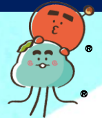
庄交オリジナルキャラクター