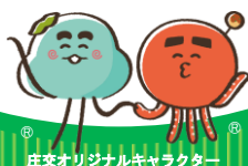
庄交オリジナルキャラクター