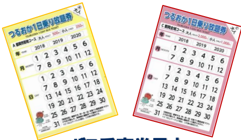
= バス乗車券見本 =